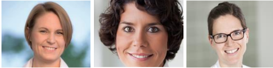
Leitung: Prof. Dr. Sara Brucker